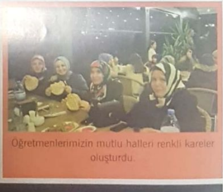
Öğretmenlerimizin mutlu halleri renkli kareler oluşturdu.