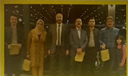
Programın Sonunda öğretmenlerimize günün anlamına özel hediyeler verildi. Programımız, öğretmenlerimizin yüreklerinde sıcaklık, yüzlerinde büyük bir tebessüm oluşturdu.