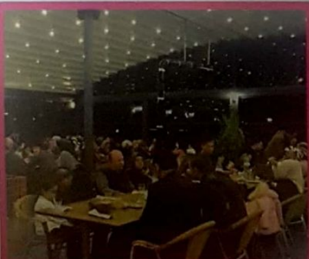
Programa tüm öğretmenlerimiz aileleriyle katıldılar.