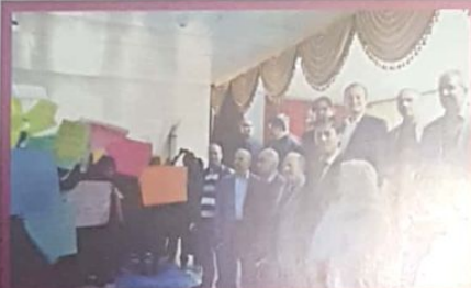
Programın ilerleyen bölümlerinde öğrencilerimiz hazırladıkları pankartlarla öğretmenlerine büyük bir sürpriz yaptılar.