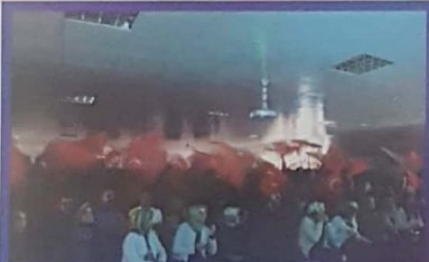
Biz Türkiye'ye isimli klbin yayınlanmasıyla öğrencilerimizin yüreğindeki vatan ve bayrak sevgisi, bütün salona taşıtı.